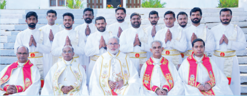
മ്ശംശാനപട്ടം സ്വീകരിച്ച പാലാ രൂപത വൈദികാർത്ഥികൾ അഭിവന്ദ്യ പിതാവിനോടും സഹകാർമ്മികരോടൊപ്പം