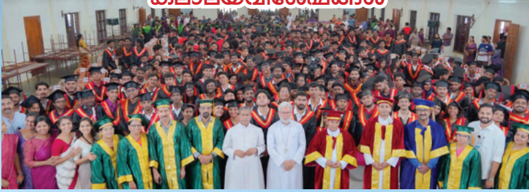
ചേർപ്പുകൾ ബി. വി. എം. കോളേജിന്റെ ബിരുദദാനച്ചടങ്ങിൽനിന്ന്