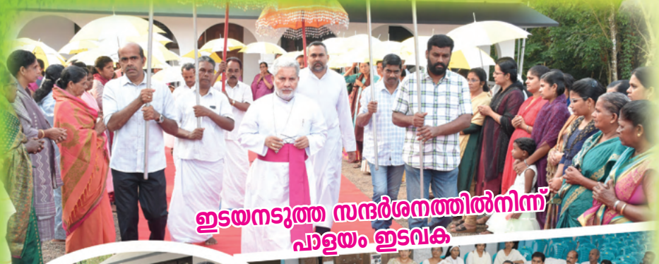
ഇടയനടുത്ത സന്ദേശനത്തിൽനിന്ന് പാളയാം ഇടവക