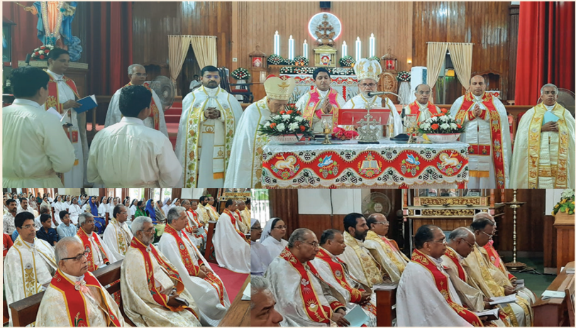
പാലാ കത്തീഡ്രൽ ദൈവാലയത്തിൽ നടന്ന മൂറോൻ കുദാശയുടെ തിരുക്കർമ്മങ്ങൾ