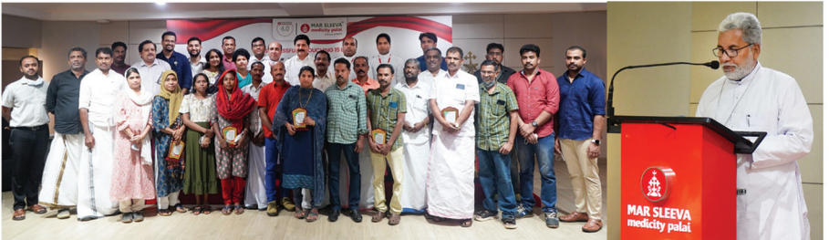
ചേർപ്പുകൽ മെഡിസിറ്റിയിൽ ആദ്യ വൃക്ക മാറ്റിവയ്ക്കൽ ശസ്ത്രക്രിയയുടെ വാർഷികത്തിൽ നടത്തിയ വൃക്കദാതാക്കളുടെയും സ്വീകർത്താക്കളുടെയും സംഗമം