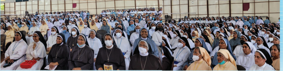
വിശുദ്ധ കുർബാന എഴുന്നള്ളിച്ചുകൊടുക്കാനുള്ള ബഹു. സിസ്റ്റേഴ്സിനായുള്ള പ്രത്യേക കോഴ്സ് കുറവിലങ്ങാട്, ഭരണസാനം പള്ളികളിൽ വച്ച് ഒക്ടോബർ 15, 24 തീയതികളിൽ നടത്തപ്പെട്ടു.