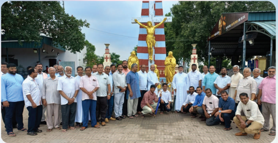
മാർത്തോമ്മാശ്ലീഹായുടെ ഭാരതപ്രവേശനത്തിന്റെ 150-ാം വാർഷികത്തിന്റെ ഭാഗമായി അഭിവന്ദ്യ മാർ ജോസഫ് കല്ലറങ്ങാട്ട് പിതാവിന്റെ നേതൃത്വത്തിൽ 40 വൈദികർ മൈലാപ്പൂർ തീർത്ഥാടനം നടത്തി.