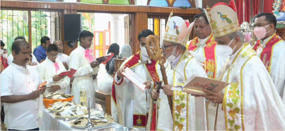
പാലാ കത്തീഡ്രലിലെ വിദ്യുതിത്തിരുനാൾ തിരുക്കർമ്മങ്ങൾക്ക് അഭിവന്ദ്യ പിതാക്കന്മാർ കാർമ്മികത്വം വഹിക്കുന്നു.