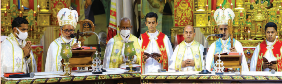
കുറവിലങ്ങാട് മേജർ ആർക്കിഎപ്പിസ്കോപ്പൽ മർത്ത് മറിയം ആർച്ചുഡീക്കൻ തീർത്ഥാടന ദൈവലയത്തിൽ മൂന്നുമനോമ്പ് തിരുനാളിനോടനുബന്ധിച്ച് അഭിവന്ദ്യ പിതാക്കന്മാർ പരിശുദ്ധ കുർബ്ബാനയർപ്പിക്കുന്നു.