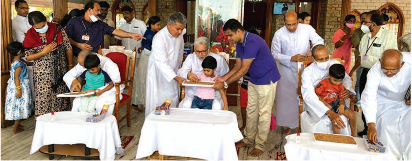
ഭരണങ്ങാനം അൽഫോൻസാ തീർത്ഥാടനകേന്ദ്രത്തിൽ പത്തക്കുസ്താന്തിരുനാളിനോടനുബന്ധിച്ച് അഭിവന്ദ്യ പിതാക്കന്മാരുടെ കാർമ്മികത്വത്തിൽ നടന്ന ആദ്യക്ഷരം കുറിക്കൽ