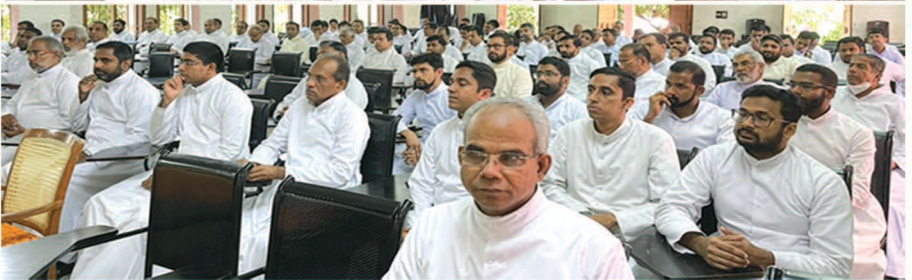
അരുണാപുരം അൽഫോൻസിയൻ പാസ്റ്ററൽ ഇൻസ്റ്റിറ്റ്യൂട്ടിൽ നടന്ന വൈദികരുടെ തുടർപരിശീലന സെമിനാർ