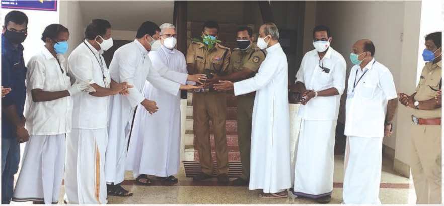
പരിണമിതിദിനത്തോടനുബന്ധിച്ച് PSWS-ന്റെ നേതൃത്വത്തിൽ പാലാ DYSP ഓഫീസിലേക്ക് നൽകുന്ന ഫലവൃക്ഷത്തൈകളുടെ വിതരണോദ്ഘാടനം അഭിവന്ദ്യ പിതാക്കന്മാർ നിർവഹിക്കുന്നു.