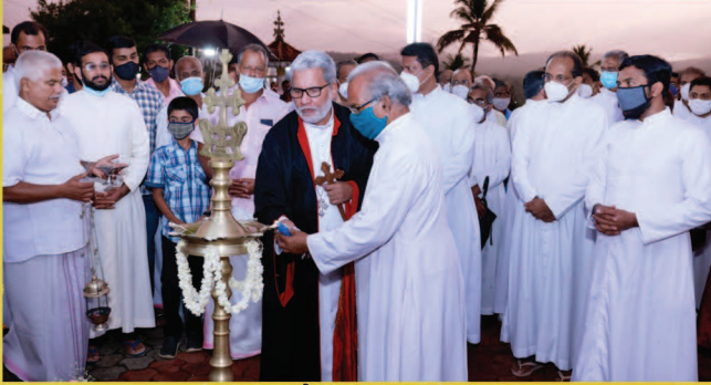
കൂടല്ലൂർ ഇടവക ദൈവാലയം