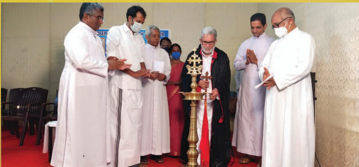
കാക്കൂർ ഇടവക ദൈവാലയം