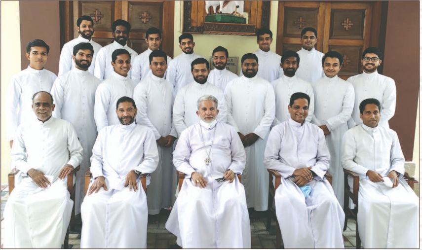
വൈദികവസ്ത്രം സ്വീകരിച്ചവർ അഭിവന്ദ്യ പിതാവിനോടൊപ്പം