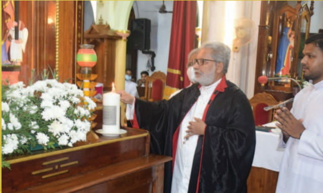
തിടനാട് ഇടവക ദൈവാലയം