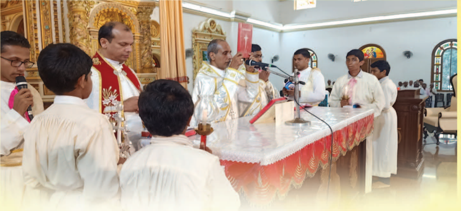
വാ. കുഞ്ഞച്ചന്റെ തിരുനാളിനോടനുബന്ധിച്ച് രാമപുരത്തുനടന്ന നാസകൂർബ്ബാനയും നേർച്ചവെഞ്ചെരിപ്പും