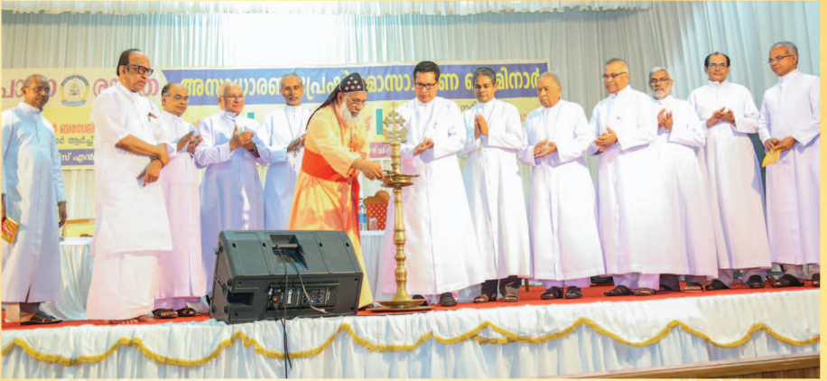
പാലാ രൂപതയുടെ ആഭിമുഖ്യത്തിൽ നടന്ന അസാധാരണ പ്രേഷിത സെമിനാർ മോറാൻ മോർ ബസേലിയോസ് മാർ ക്ലിമിസ് കാതോലിക്കാ ബാവ ഉദ്ഘാടനം ചെയ്യുന്നു.