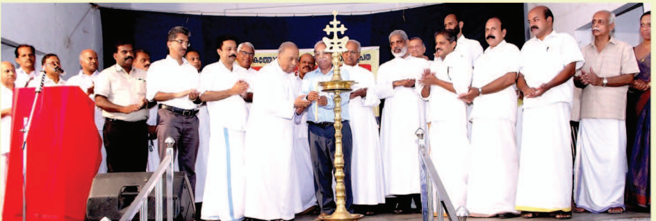
കത്തോലിക്കാ കോൺഗ്രസ്സ് നൂറ്റിയൊന്നാം ജന്മവാർഷിക സമ്മേളനം