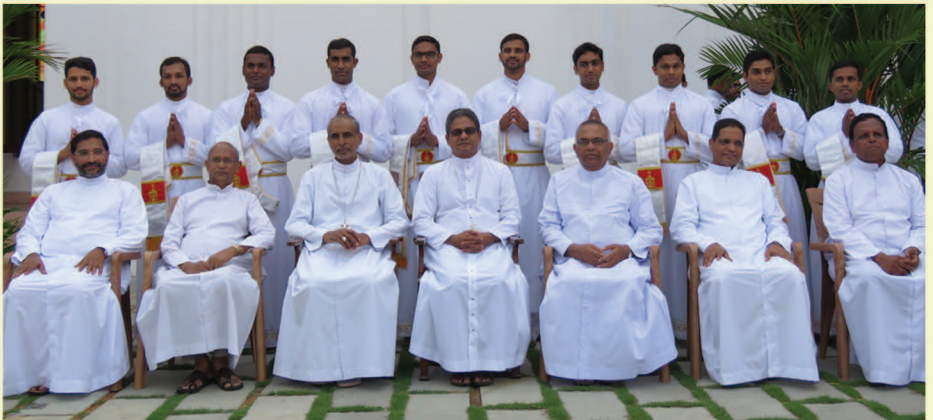
കാരായ പട്ടം സ്വീകരിച്ചവർ അഭിവന്ദ്യ പിതാക്കന്മാരോടൊപ്പം