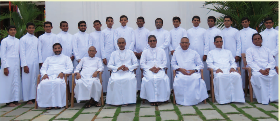
വൈദികവസ്ത്രം സ്വീകരിച്ചവർ അഭിവന്ദ്യ പിതാക്കന്മാരോടൊപ്പം