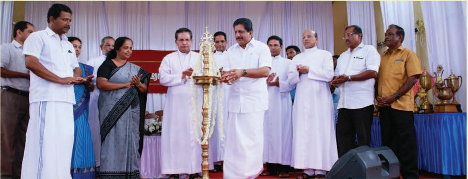
പാലാ സോഷ്യൽ വെൽഫെയർ സൊസൈറ്റി വാർഷികദിന ആഘോഷം