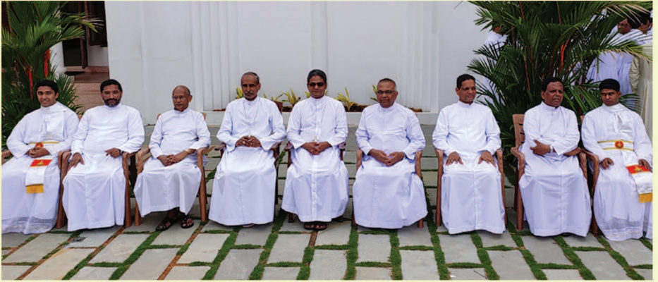
ഹെഡ്പർയാക്കോന പട്ടം സ്വീകരിച്ചവർ അഭിവന്ദ്യ പിതാക്കന്മാരോടൊപ്പം