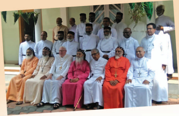
ഓർത്തഡോക്സ് സഭയും കത്തോലിക്കാസഭയും തമ്മിൽ നടന്ന ഏകുമെനിക്കൽ ഡയലോഗ് സമ്മേളനം മാങ്ങാനം - വടവാതുർ സ്പിരിച്ചാലിറ്റി സെന്ററിൽ